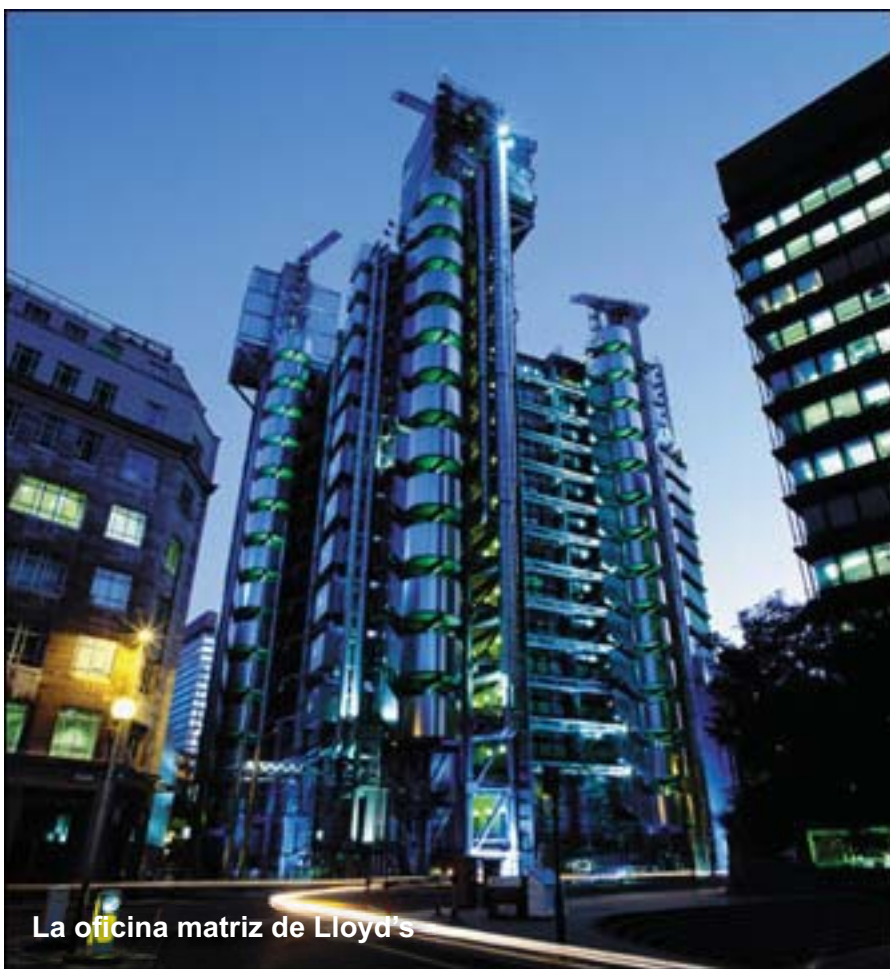
La oficina matriz de Lloyd's